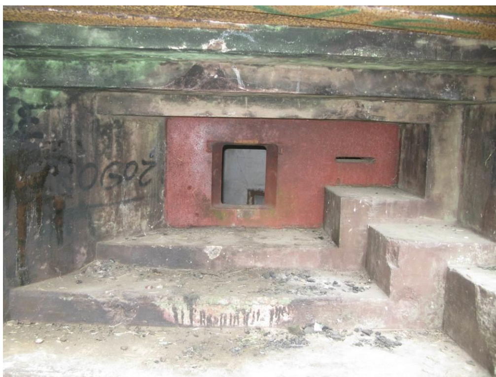
zdj. 5 – Okienko strzelnicze do zabezpieczenia.