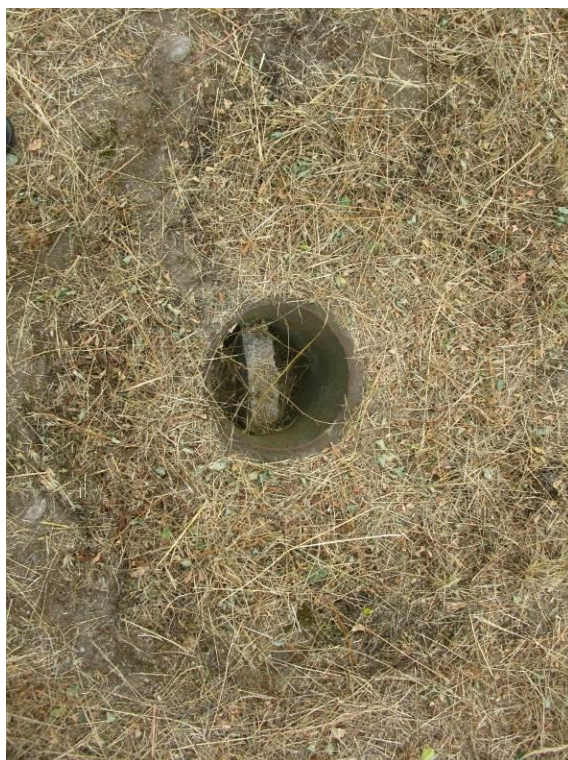
zdj. 6 – Otwór wentylacyjny do zabezpieczenia.