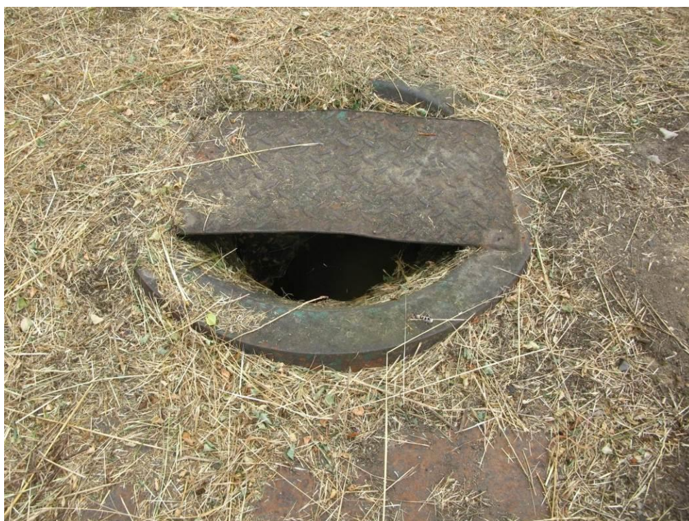
zdj. 7 – Szyb wentylacyjny, prowizorycznie zabezpieczony