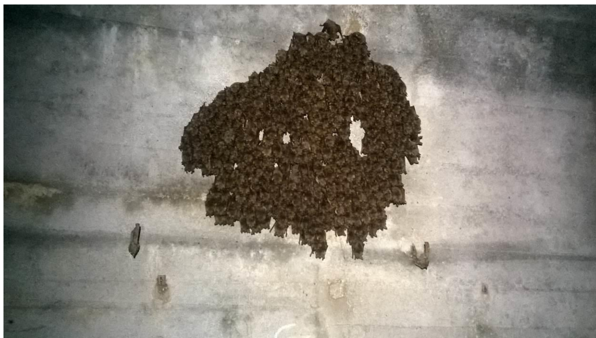
zdj. 1 – Nietoperze zimujące w MRU.

System korytarzy stanowi również największe w Polsce zimowisko nietoperzy. Szacuje się, że rok rocznie zimuje ich w MRU około 35 tys. W 1998 roku utworzono rezerwat przyrody „Nietoperek” oraz ograniczono wejście turystów do niektórych korytarzy w okresie zimowym. Ze względu na rozległy obszar umocnień oraz liczne wejścia w niekontrolowanych miejscach Dyrekcja muzeum od lat stara się zabezpieczać korytarze kratami, z których słabsze konstrukcje zostają wycięte krótko po montażu. W ramach zadania przewiduje się wykonanie 10 krat zabezpieczających wejścia muzeum, rezerwatu oraz obszarów gdzie stwierdzono największe skupiska nietoperzy. Kraty wykonane zostaną zgodnie z zaleceniami chiropterologa.