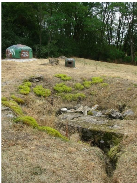
zdj. 10 – Obiekt 2 – stan istniejący.