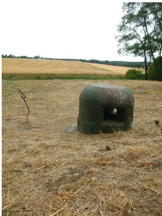
zdj. 11 – Obiekt 2 – jedna z kopulek.