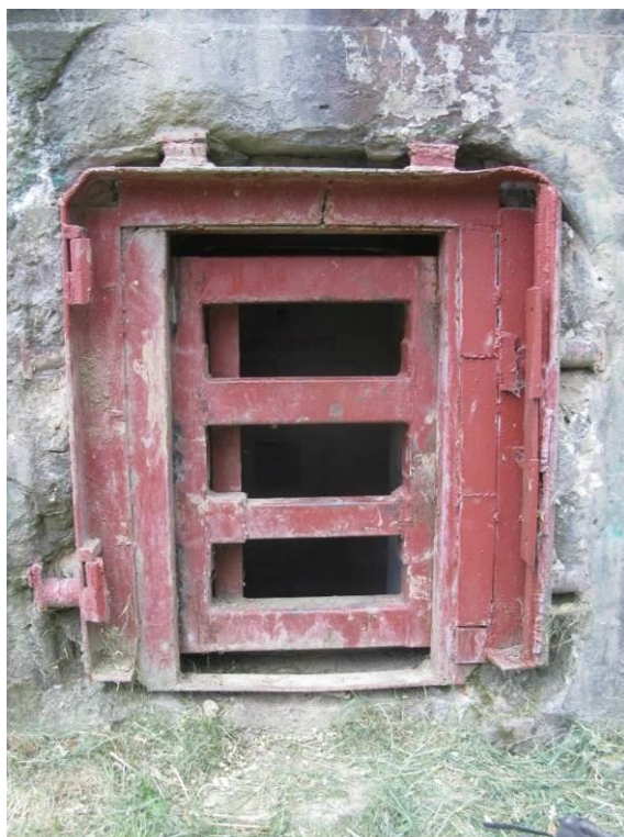
zdj. 4 – Zabezpieczenie wejścia – stan obecny.