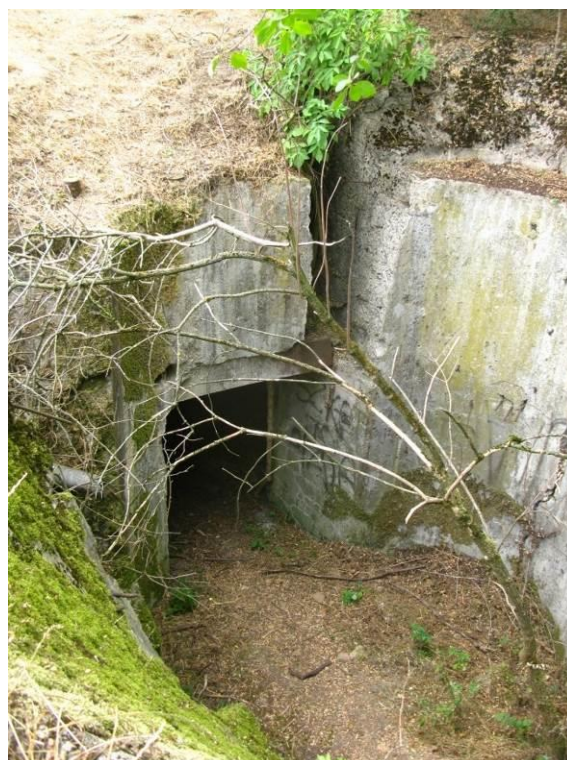
zdj. 9 – Obiekt 2 – stan istniejący.