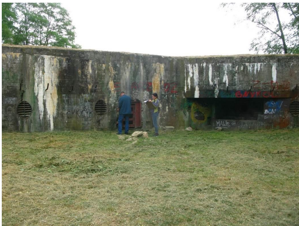
zdj. 3 – Widok na wejście do obiektu 2.