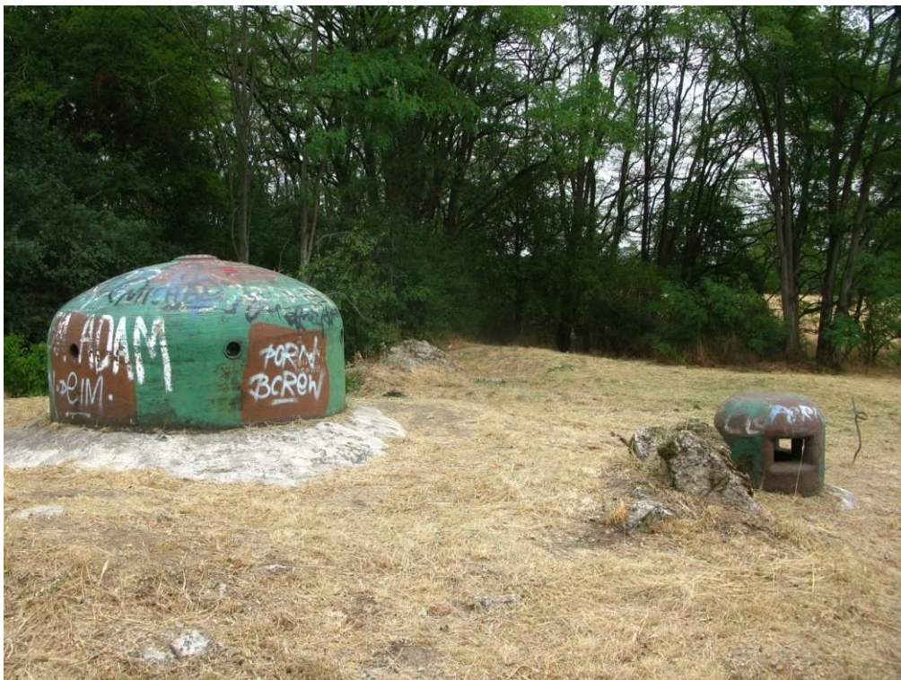
zdj. 8 – Widok na kopułki strzelnicze.