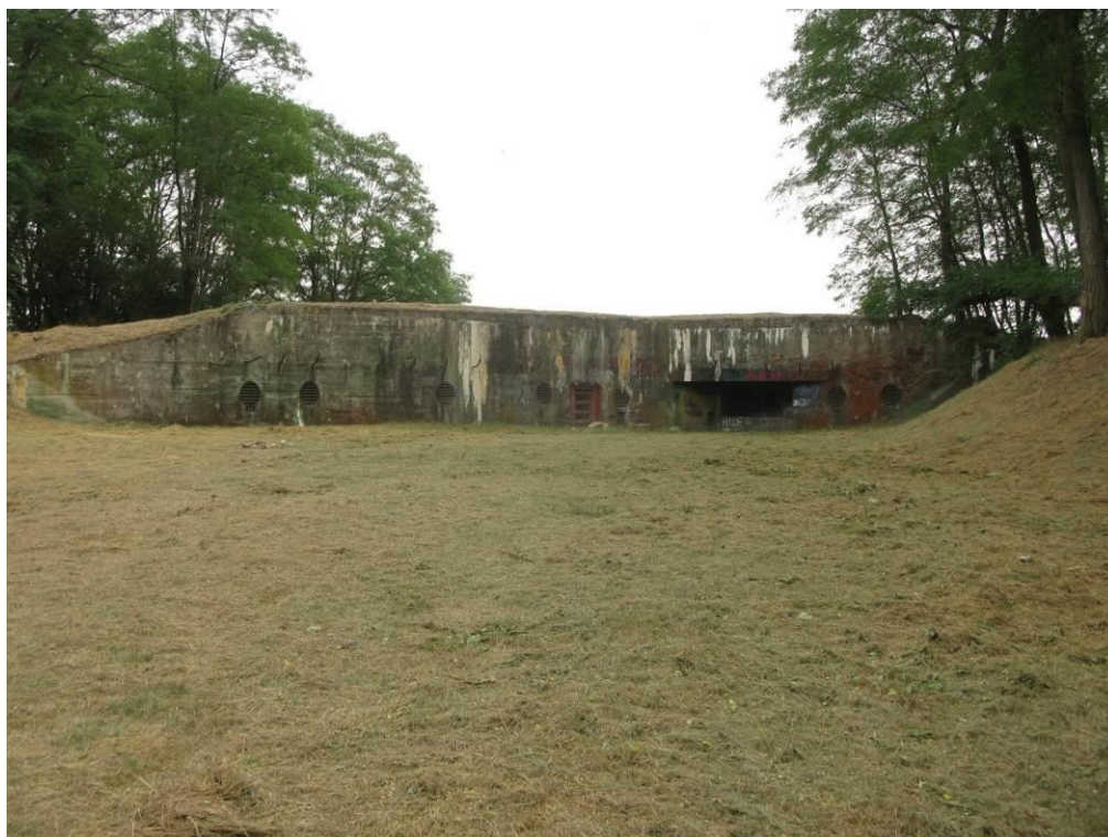
zdj. 2 – Widok na obiekt 2.